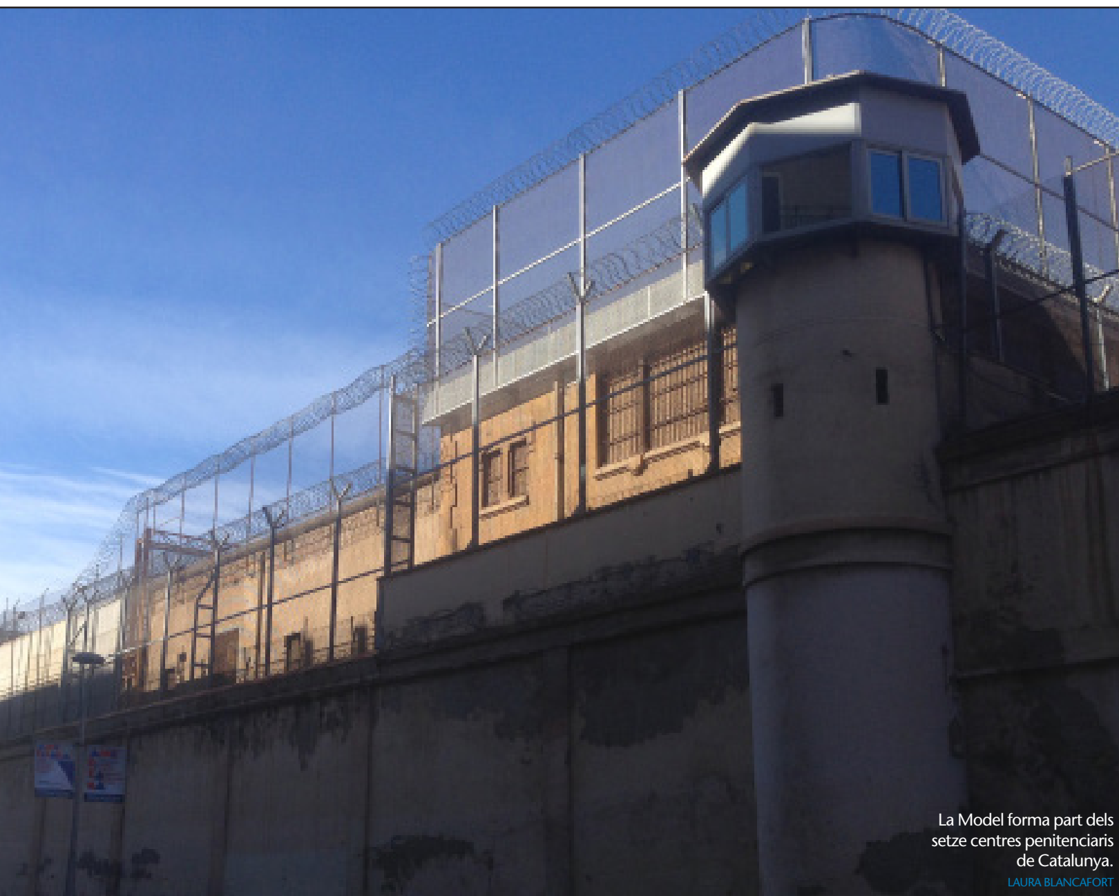
La Model forma part dels setze centres penitenciaris de Catalunya.